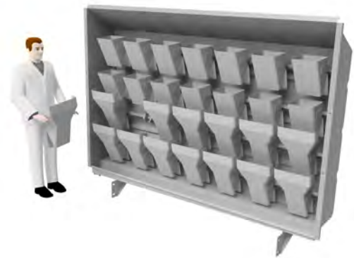
Afbeelding 8. JASA reinigingswand.

De QB- en QA-platforms kunnen worden uitgerust met een reinigingswand voor het nat reinigen van weeg- en bufferbakken. Er wordt gereinigd met een hogedruk waterstraal waarbij de reinigingswand voorkomt dat er water in het pand wordt geblazen. De platformvloer is voorzien van een goot die het water van het platform opvangt en afvoert.