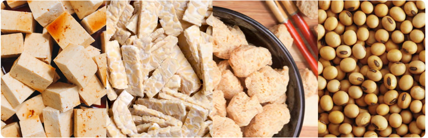
Afbeelding 11. Soorten Vleesvervangers.

Een linzenburger, een kaasschnitzel, falafel. Vleesvervangers zijn er in allerlei soorten en maten. Die verschillende soorten vragen om verschillende verpakkingstypes, -groottes, -materialen en verpakkinglijnen