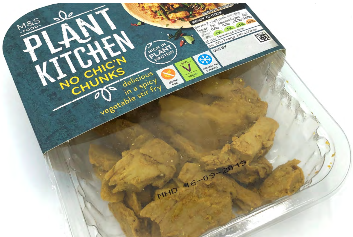
Afbeelding 1. Vleesvervangers met sleeve verpakking.

De sleeves bieden geweldige bedrukkingsmogelijkheden, hogere resoluties en veel flexibiliteit. Zelfs de binnenkant kan bedrukt worden. Hierdoor valt het product gegarandeerd op in het schap.