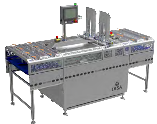
Afbeelding 6. JASA dubbele sleevermachine.

Met de kartonnen sleeve van de JASA Sleever blijven de vleesvervangers goed zichtbaar, maar is er ook veel ruimte voor marketing op de verpakking, zoals logo's, een recept of een sterke claim omtrent milieuvriendelijkheid. De sleeves zijn ook nog eens hartstikke milieuvriendelijk: ze zijn 100% geschikt voor recycling.