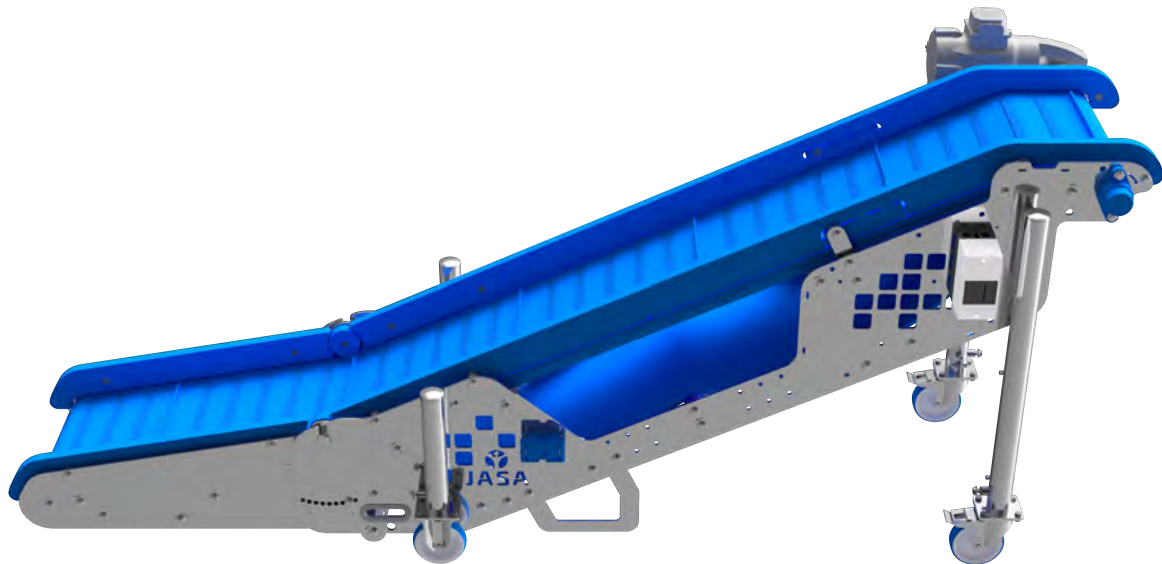
Afbeelding 7. JASA uitvoerband.