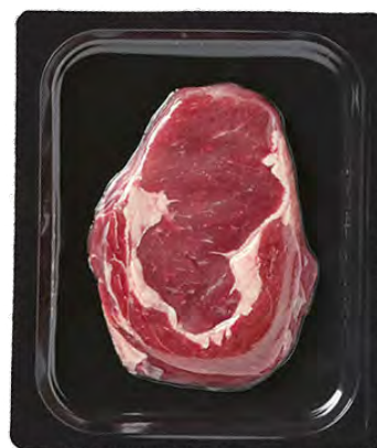
Afbeelding 14. JASA skinpack.

Hierbij wordt het product geheel vacuüm getrokken en omwikkeld in de verpakking. Zo neemt de verpakking de vorm aan van het product.