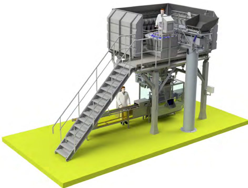
Afbeelding 9. Voorbeeld van een complete schalenlijn.

Zie afbeelding 8 als voorbeeld van een complete schalenlijn. Dit is een basisopzet met afmetingen van 19m (lengte) bij 3,9m (breedte) bij 4,7m (hoogte). Afhankelijk van de ruimte waarin de lijn geplaatst wordt en alle wensen betreffende de lijn wordt deze aangepast aan de beschikbare dimensies.