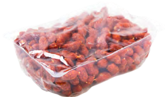
Afbeelding 13. JASA dieptrekverpakking.

Een dieptrekverpakking bestaat uit een onder- en een bovenfolie. De folie wordt gevormd in de vormingsmal door middel van vacuüm of perslucht. Deze verpakking is hierdoor geschikt om producten vacuüm of begast te verpakken.