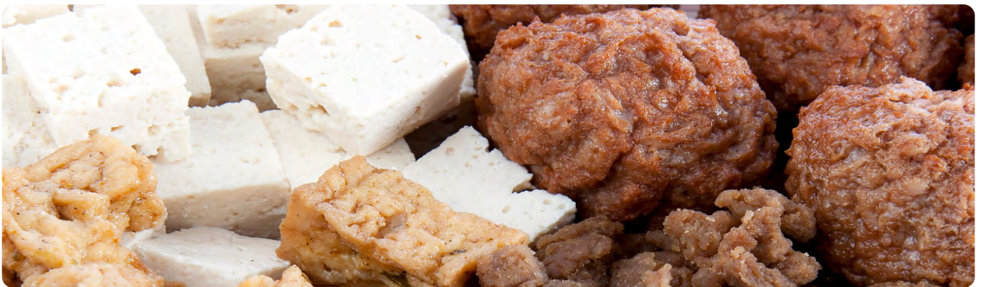
Afbeelding 3. Vleesvervangers.

Vleesvervangers worden gekoeld getransporteerd naar de verpakkinglijn, die kan bestaan uit diverse voor het product benodigde componenten. Afhankelijk van het product, het volume, de verpakking en de wensen van de klant zijn er de volgende componenten van een verpakkinglijn voor vleesvervangers.