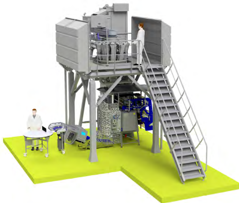
Afbeelding 10. Voorbeeld van een verticale verpakkingslijn.

Zie afbeelding 9 als voorbeeld van een verticale verpakkingslijn. Dit is een basisopzet met afmetingen van 10m (lengte) bij 4,4m (breedte) bij 5,9m (hoogte). Afhankelijk van de ruimte waarin de lijn geplaatst wordt en alle wensen betreffende de lijn wordt deze aangepast aan de beschikbare dimensies.