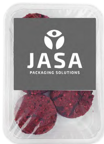
Afbeelding 4. Top-Seal-Verpackung.

In het geval van een schaalverpakking wordt er tegenwoordig meestal gekozen voor het sluiten van de verpakking door middel van een topseal folie aan de bovenzijde. Deze folie kan hersluitbaar zijn, of een peel-off venster hebben. Ook is het mogelijk om te kiezen voor skinpack, die zich volledig naar het product vormt en de verpakking af te maken met een stijlvolle sleeve eromheen.