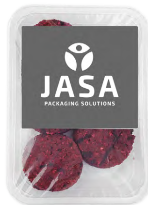
Afbeelding 12. JASA topseal schaal.

Deze schaalverpakking wordt afgesloten met een topseal. De inhoud van de verpakking varieert van 85 tot 1000 gram en is geschikt om te combineren met een sleeve.