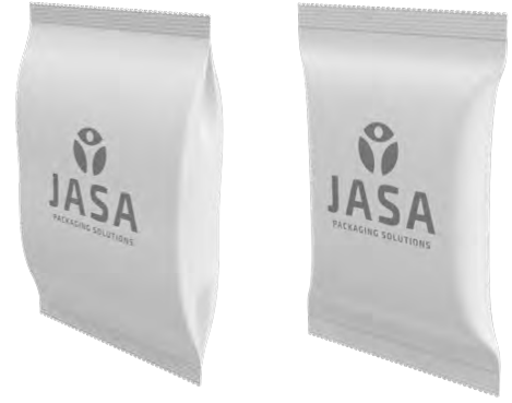
Afbeelding 15. JASA zakverpakkingen.

Deze verpakkingen zijn geschikt om te vacumeren en diepvriesproducten in te verpakken. Ook grootverpakkingen zijn mogelijk, die geschikt zijn voor bijvoorbeeld de horeca.